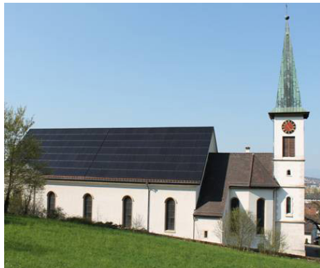
Ettingen (Schweiz) - Fa. Solvatec