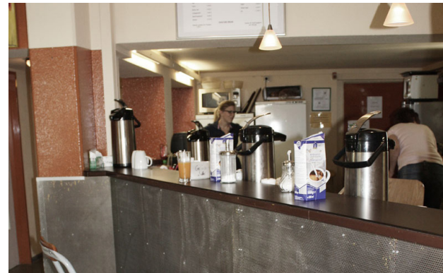
Café Patchwork in Siegen