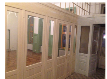
Blick in unseren Coworking Space

Doch dann kam die Pandemie, in der unsere Einnahmequellen wegfielen und wir nun vor erheblichen finanziellen Herausforderungen stehen. Damit nicht genug, taten sich einige BewohnerInnen des Dachgeschosses zusammen und versuch(t)en, unser Projekt mit Gerichtsverfahren zu verhindern. Sie können es zwar nicht verhindern, aber sehr wohl verzögern. So viele in unserer Umgebung freuen sich auf das Café und bewundern unseren Ballsaal. Aber gemäß Friedrich Schiller: Es kann der Frömmste nicht in Frieden leben, wenn es dem bösen Nachbarn nicht gefällt. Somit bitten wir gern um Eure Gebete, denn nur den BeterInnen kann es gelingen.