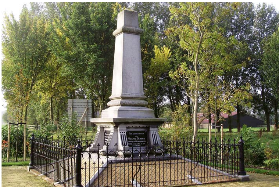
Das Menno-Simons-Denkmal in Witmarsum/Niederlande

Zu einem besonderen Streitpunkt sollte sich die Frage der Gemeindezucht entwickeln. Die Gemeindezucht war Menno Simons und den Seinen sehr wichtig, da ihnen eine Gemeinde „ohne Flecken und Runzeln“ (s. Eph 5,27) stets als verpflichtendes Ideal vor Augen stand. Daher wurden ihre Mitglieder auch zu einer Art von alternativem Lebensstil – als Ausdruck konsequenter Christusbachfolge – aufgerufen, der in deutlicher