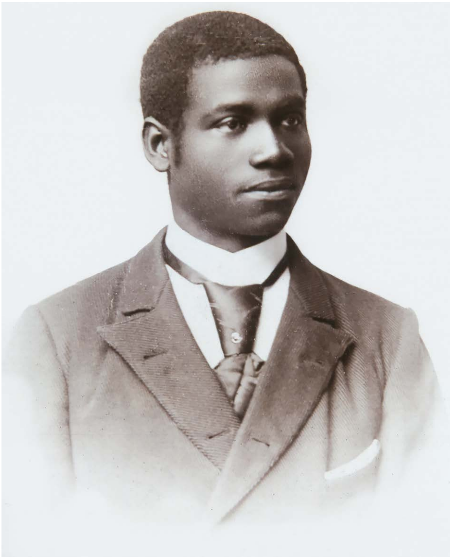
Rudolf Manga Bell (1873-1914)